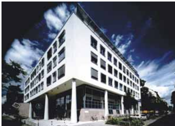
Das Institutsgebäude des ZEW.