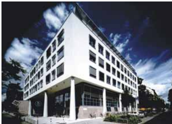
Das Institutsgebäude des ZEW.

Zentrum für Europäische Wirtschaftsforschung GmbH (ZEW) Steffi Spiegel Postfach 10 34 43 68034 Mannheim